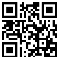
Interior 2.3 | Essential

Industriestrasse 38 CH-5314 Kleindöttingen T +41 (0)56 268 83 11 infoswiss@fundermax.biz www.fundermax.com